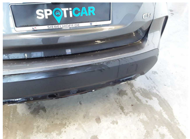
Beschädigung #6: Stossfänger hinten: Stossfänger hinten (unlackiert) - Kratzer