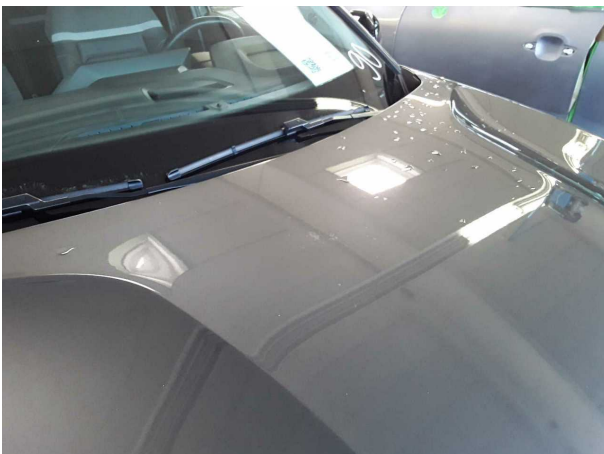
Beschädigung #3: Motorhaube: Motorhaube - verschmutzt