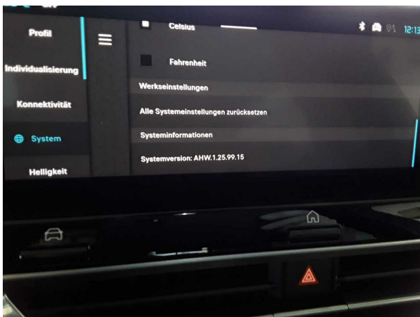
Abbildung 5: Instrumententafel