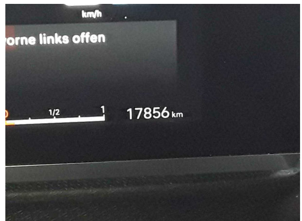
Abbildung 4: Laufleistung