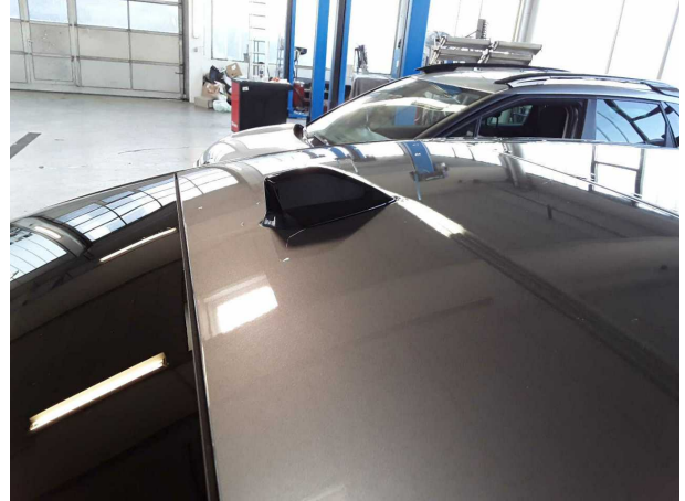
Beschädigung #2: Fahrzeugdach: Dach - Delle(n)