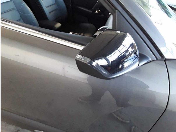
Beschädigung #1: Außenspiegel rechts: Spiegelgehäuse - Kratzer