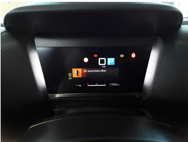
Abbildung 3: Kombiinstrument