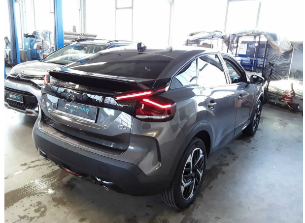
Abbildung 2: Schräg hinten