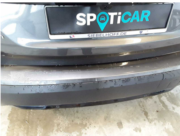
Beschädigung #5: Stossfänger hinten: Stossfänger hinten - Kratzer