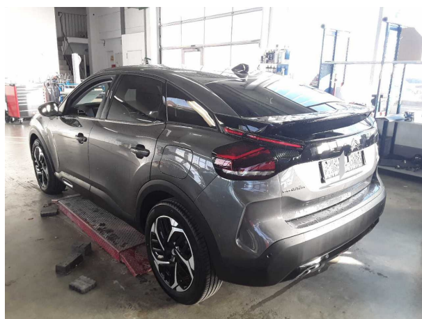
Abbildung 4: Schräg hinten