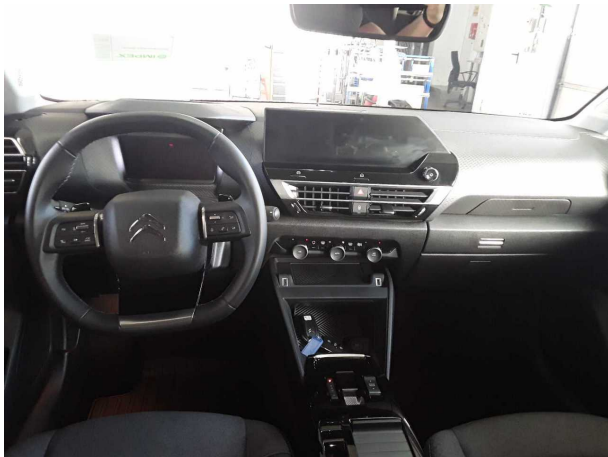
Abbildung 9: Instrumententafel