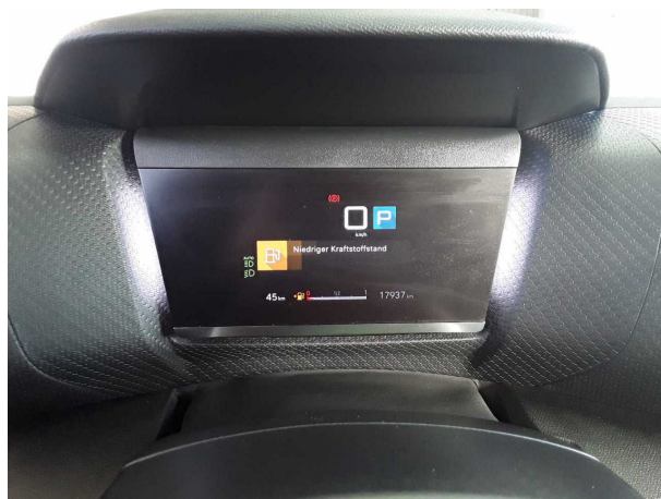
Abbildung 6: Kombiinstrument