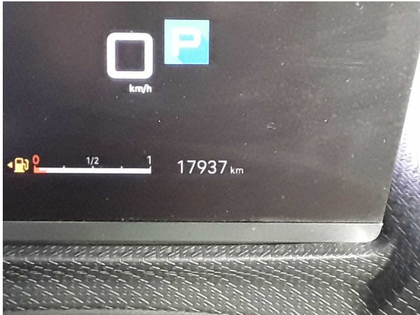
Abbildung 7: Laufleistung