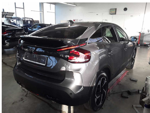
Abbildung 3: Schräg hinten