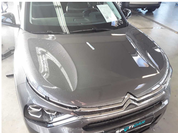
Beschädigung #1: Motorhaube: Motorhaube - Delle(n)