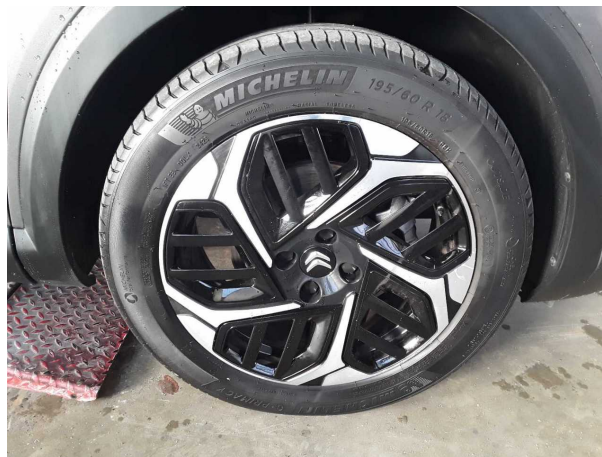
Beschädigung #2: Rad/Reifen: Leichtmetallfelge vorn rechts - beschädigt