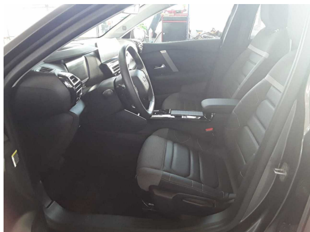
Abbildung 5: Innenraum