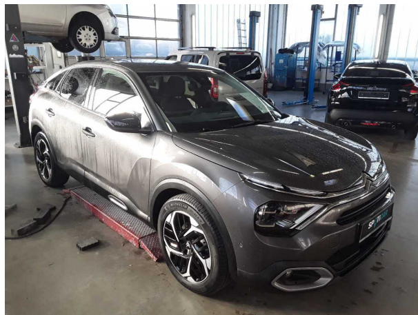
Abbildung 2: Schräg vorne