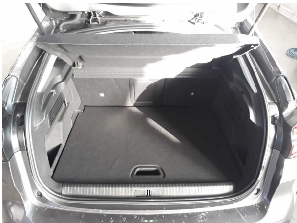
Abbildung 11: Laderaum