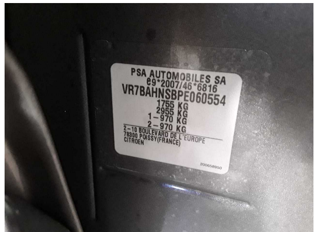
Abbildung 12: FIN

PSA AUTOMOBILES SA 69 2007/46 6816 VR7BAHNSBPE060554 1755 KG 2955 KG 1-970 KG 2-970 KG 2-10 BOULEVARD DE L'EUROPE 78300 POISSY (FRANCE) CITROEN 20060850