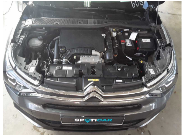
Abbildung 10: Motorraum