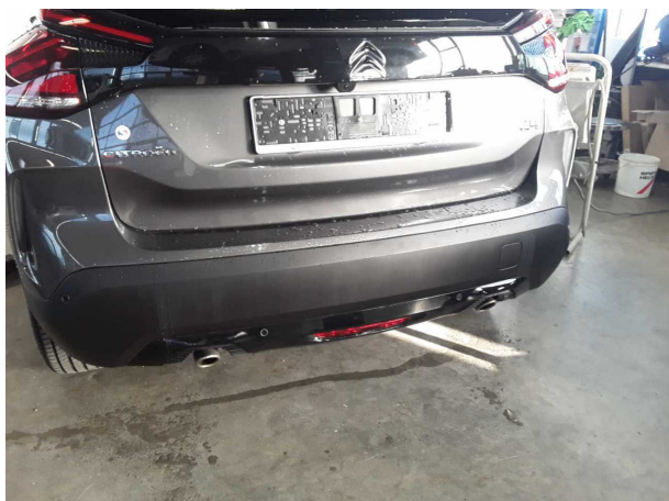
Beschädigung #3: Stossfänger hinten: Stossfänger hinten (unlackiert) - Kratzer