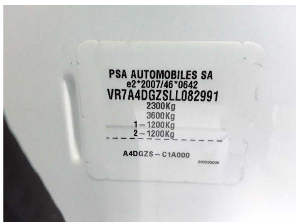
Abbildung 3: FIN