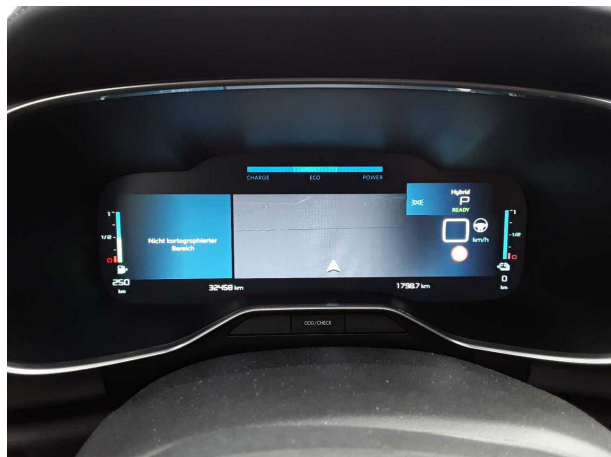
Abbildung 1: Kombiinstrument