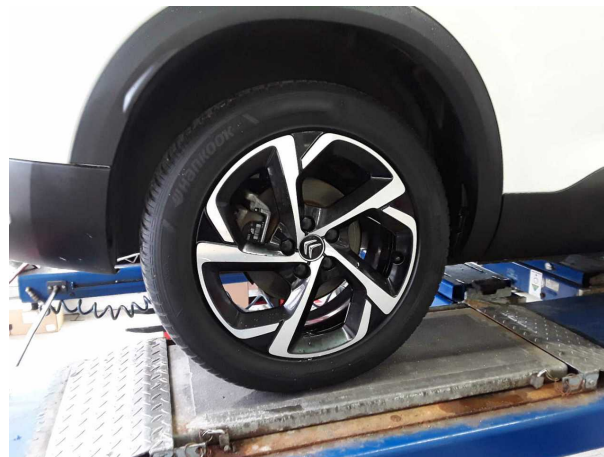
Beschädigung #2: Rad/Reifen: Leichtmetallfelge hinten rechts - Kratzer - kein Abzug